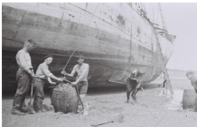
Nästa dag väntar arbete med att lasta barlast. Det är ebb och barlasten består av sand från havsbotten.