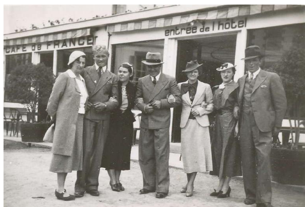
Välklädda herrar med eleganta damer. Tänk tjejer när detta hattmode kommer tillbaka!

Tvgning innan landgång! Isolda saknade dusch. Men en iskall avrivning innan man går iland i en fransk hamn är bara uppiggande!