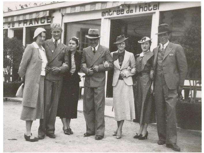
Klart man träffade tjejer! Kolla hattarna!