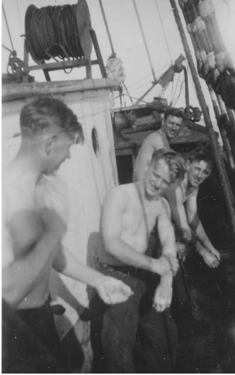
Vaskning innan landgång