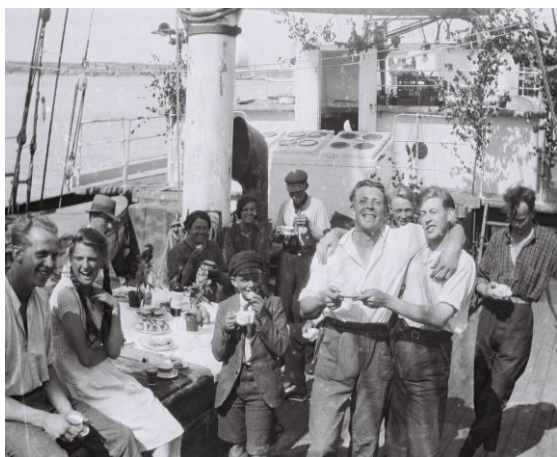
Midsommarfirande på Isolda