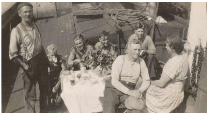
Kaffe på däck!